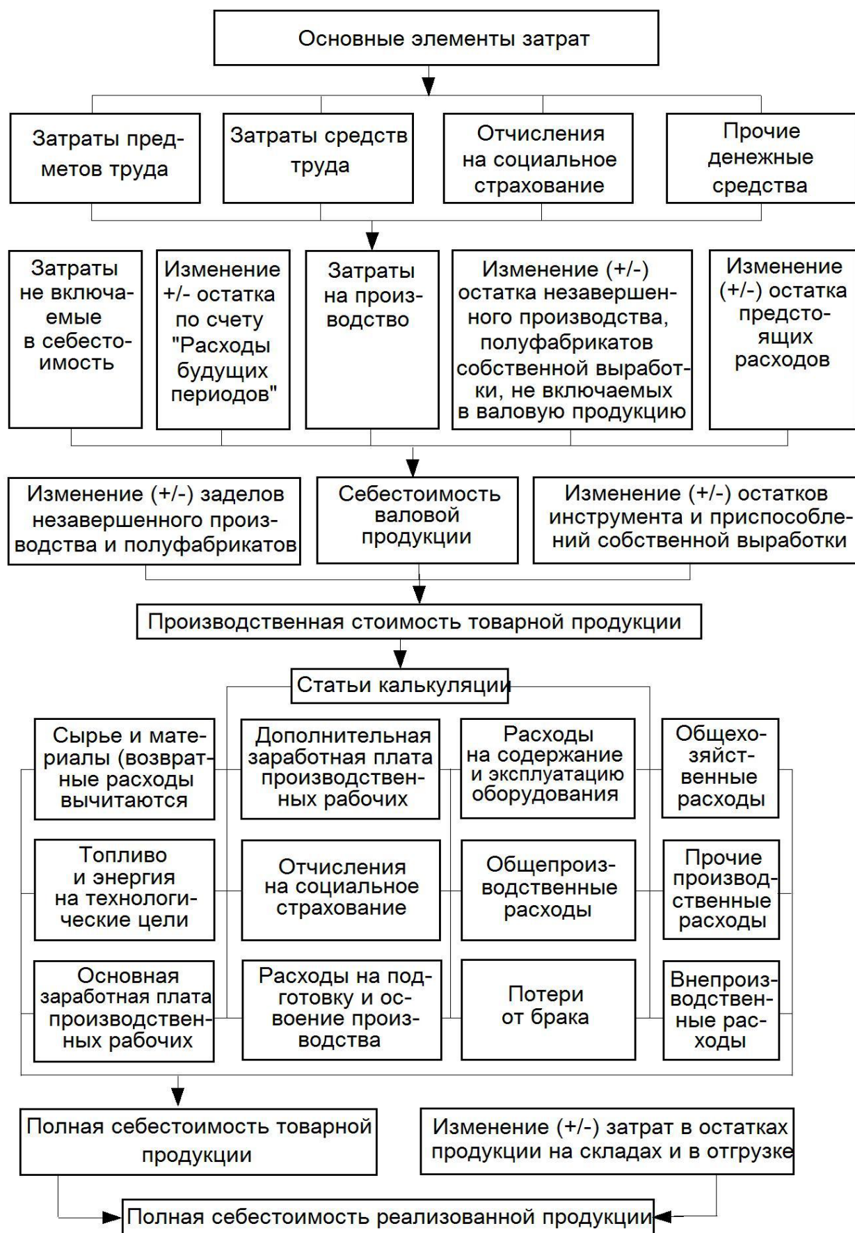
Схема формирования себестоимости